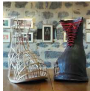
Les bottes de l'ogre