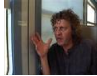
Transports amoureux. Cop. : Kuiv Productions

Amour, sexe et mobylette , de Maria Silva Biazzoli et Christian Lelong (samedi 12 novembre 2011 à Murat, cinéma, 20h30)