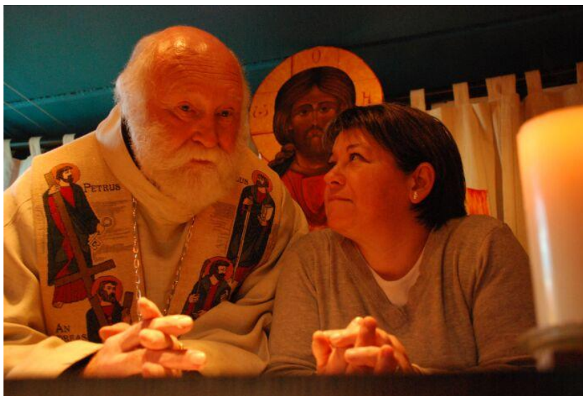
Ainsi soit-il.Cop.Azimut Prod.

Le mois du film documentaire est une manifestation nationale, initiée par le Ministère de la Culture et l'association Images en bibliothèques depuis une douzaine d'années. Chaque année, au mois de novembre, 120.000 spectateurs assistent à la projection de plus de 2.000 films à travers un réseau de 1.300 lieux (médiathèques, salles de cinéma, établissements culturels, musées, centres culturels à l'étranger...) sur le territoire métropolitain et dans les départements et territoires d'outre-mer. L'objectif est de faire mieux connaître la richesse du cinéma documentaire, en proposant au public de visionner des films rares ou inédits, de faire découvrir des réalisateurs passionnés, de permettre des échanges vivants et spontanés entre le public et les créateurs.