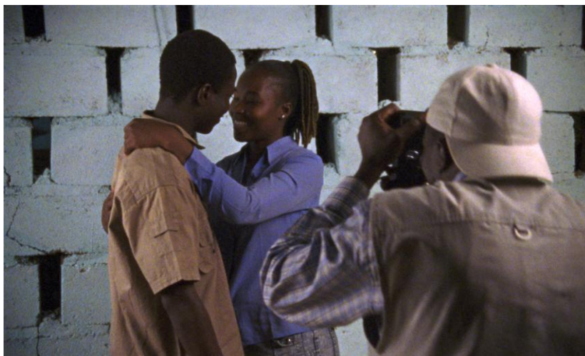
Amour, sexe et mobylette.

Notre programmation vous propose 6 témoignages (réels et authentiques : nous sommes dans le documentaire, pas dans la fiction !), 6 histoires d'amour toutes différentes et toutes émouvantes. Venez partager un moment les sentiments de Vanessa, de Manu, d'Amanda, de Marie-Louise, de Jean et des autres, et portez avec chaque réalisateur un regard pudique, sensible, grave ou étonné mais toujours respectueux sur leurs destins parfois tourmentés.