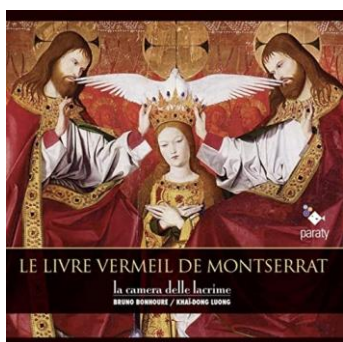
la pochette du CD Le Livre Vermeil de Montserrat la camera delle lacrime