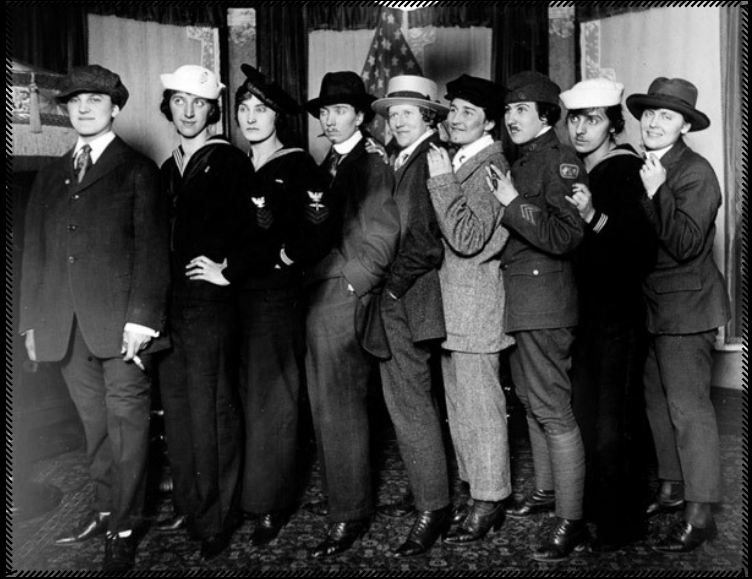
Sujets inconnus

27 octobre | 15h30 - 18h 28, 29, 30 octobre | 18h30 - 21h 31 octobre | 18h - 22h : atelier pour installer les photos